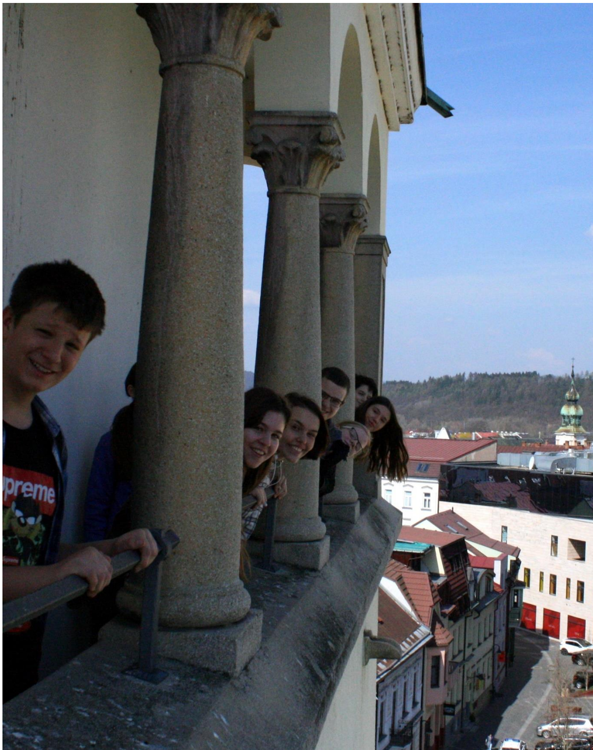
Na ochodzi Burianovej veže v Žiline.